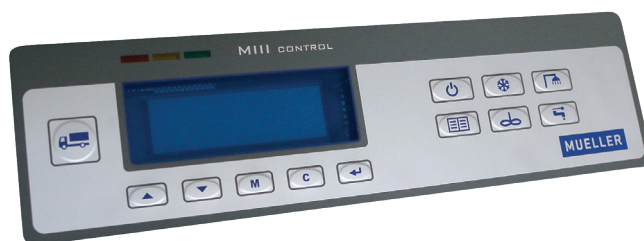
Quadro di comando MIII

Ampio display di visualizzazione di data, ora e temperatura del latte e informazioni sul sistema in più lingue