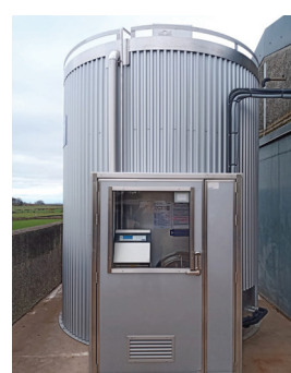
Vista de la alcoba del silo

*Los colores de este folleto pueden diferir de los reales.